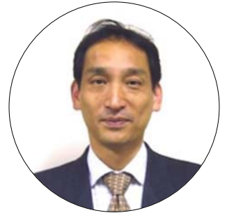
中山 徹 奈良女子大学教授 (都市計画学、自治体政策学)